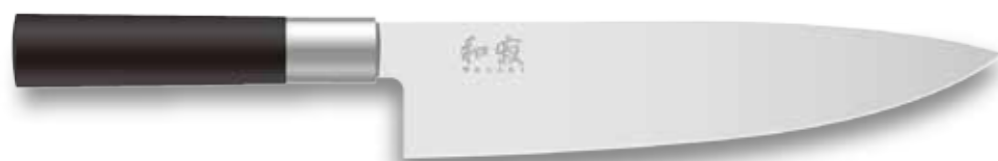
6720C Chef's 200mm