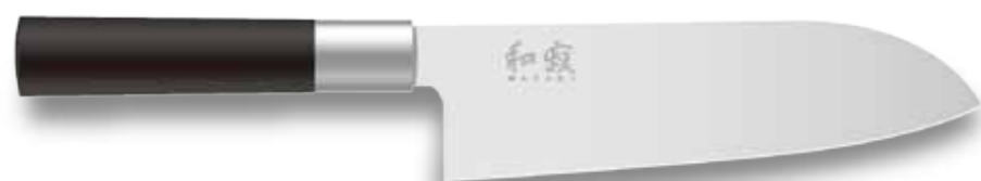
6716S Santoku 165mm