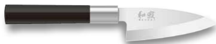
6710D Deba 105mm