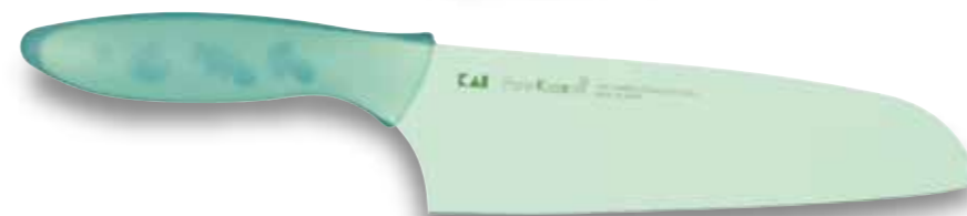
AB-1100 Faca Santoku