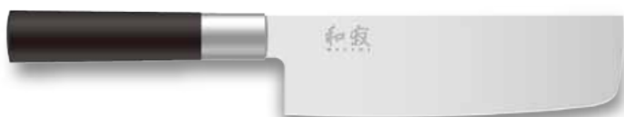
6716N Nakiri 165mm