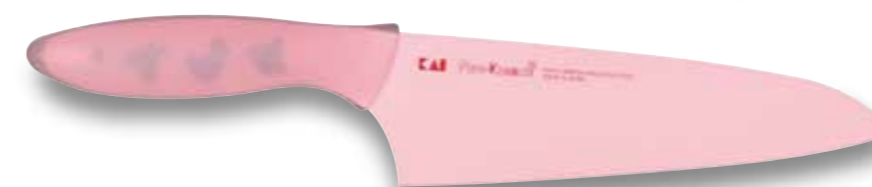
AB-1101 Faca do Chef